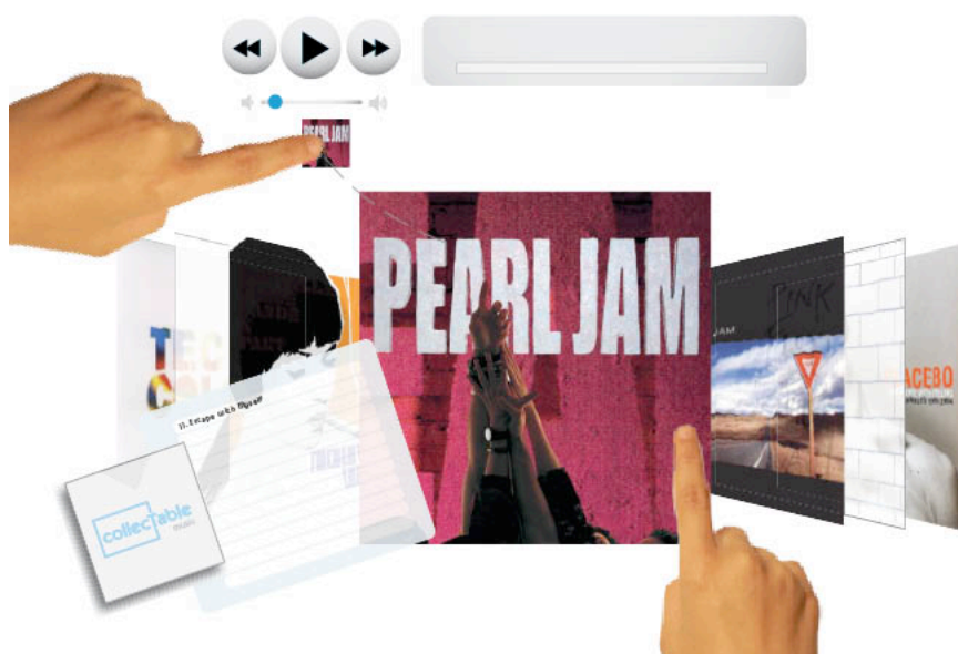
Figura 1: Manipulação de objetos flutuantes com os dedos. Álbuns no Cover Flow , no centro, são selecionados, mão direita na Figura, enquanto que um determinado álbum pode ser arrastado e colocado no tocador, mão esquerda na Figura, ou no fiducial à esquerda (com o logo collecTable ).

A primeira parte, de navegação entre álbuns e faixas de música, é baseada no Cover Flow do iTunes ™ , porém acrescentando novos recursos. Objetos da coleção tornam-se objetos flutuantes, manipulados com toque e arraste, que podem ser colocados na lista para reprodução, no próprio tocador ou serem associados a um fiducial (objeto com código que remete a um mini-disco), como mostra a Figura 1.