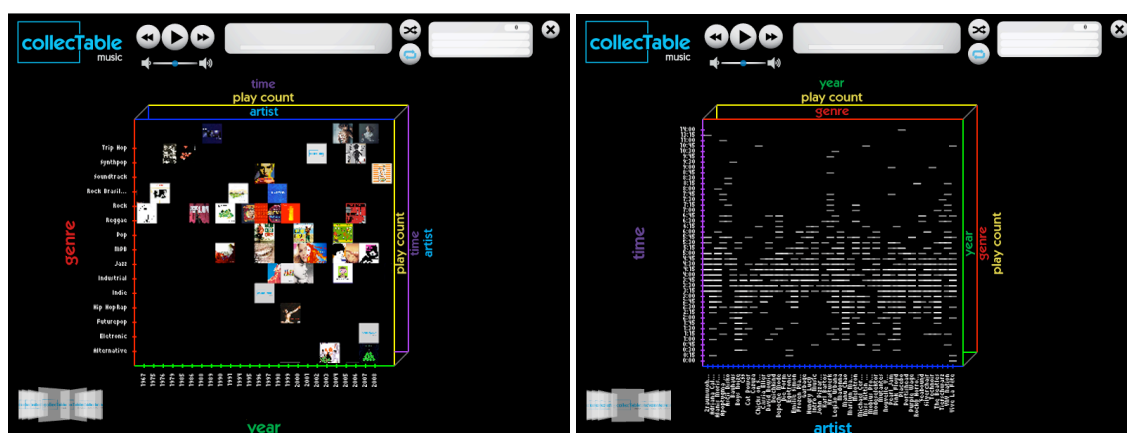
Figura 5: Os dois modos de visualização do M-Cube: capas de álbuns ou faixas de música como elementos do gráfico.

Para a organização das informações nos eixos cartesianos, também foi necessário definir um critério de ordenação, visto que valores de atributos estariam dispostos em linha. Valores textuais foram organizados em ordem alfabética enquanto que valores numéricos, que consistiam em tempo, quantidade e tamanho, em ordem crescente.